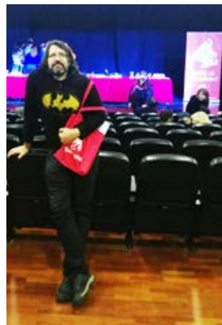
Representación de la Asamblea de IU Valdemorillo