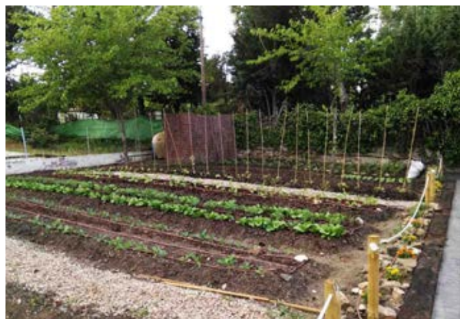
Huertos urbanos en la calle Virgen de la Esperanza

Mucho trabajo quedó por realizar y algunos de nuestros proyectos fueron paralizados, pero eso será objeto de un nuevo artículo en el próximo boletín.■